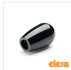
ELESA Original design I.222